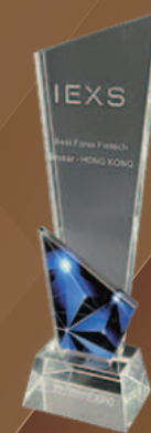
โบรกเกอร์ Fintech Forex ที่ดีที่สุดในเอเชีย

ในเดือนกันยายน ปี 2021 IEXS ได้รับรางวัล "โบรกเกอร์ Fintech Forex ที่ดีที่สุดในยุโรปประจำปี 2020" รางวัลนี้ได้รับหลังจากการวิเคราะห์อย่างละเอียดของบริษัทที่ทำได้ดีที่สุดในตลาดต่าง ๆ และเป็นการประเมินรายปีที่มีอำนาจและมีอิทธิพลมากที่สุดในการอุตสาหกรรม